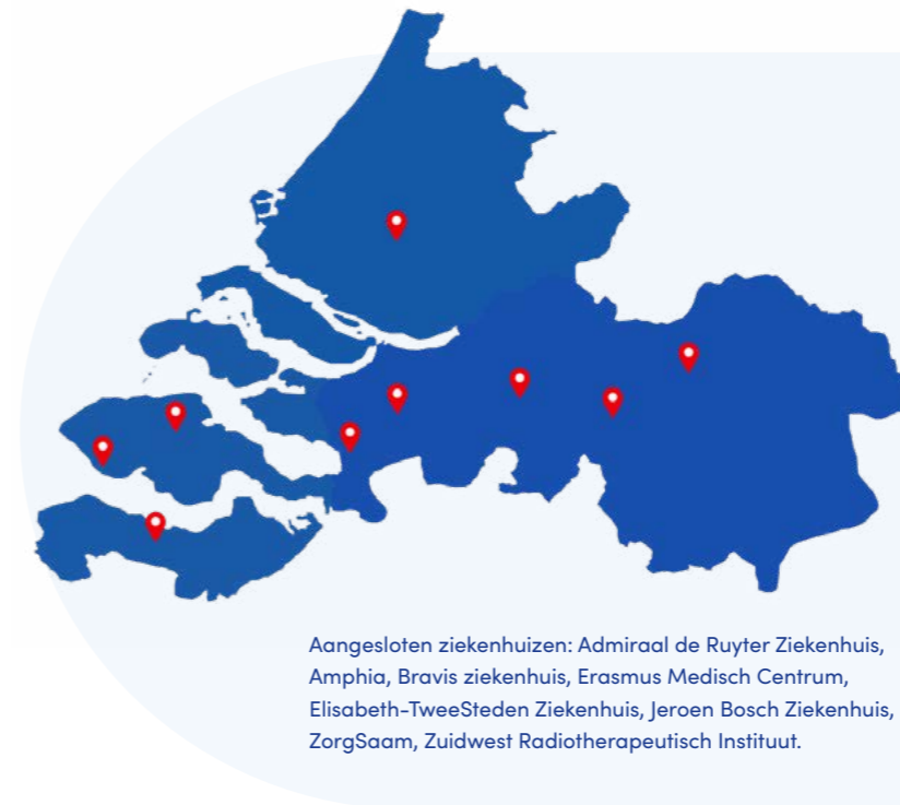
Aangesloten ziekenhuizen: Admiraal de Ruyter Ziekenhuis, Amphia, Bravis ziekenhuis, Erasmus Medisch Centrum, Elisabeth-TweeSteden Ziekenhuis, Jeroen Bosch Ziekenhuis, ZorgSaam, Zuidwest Radiotherapeutisch Instituut.